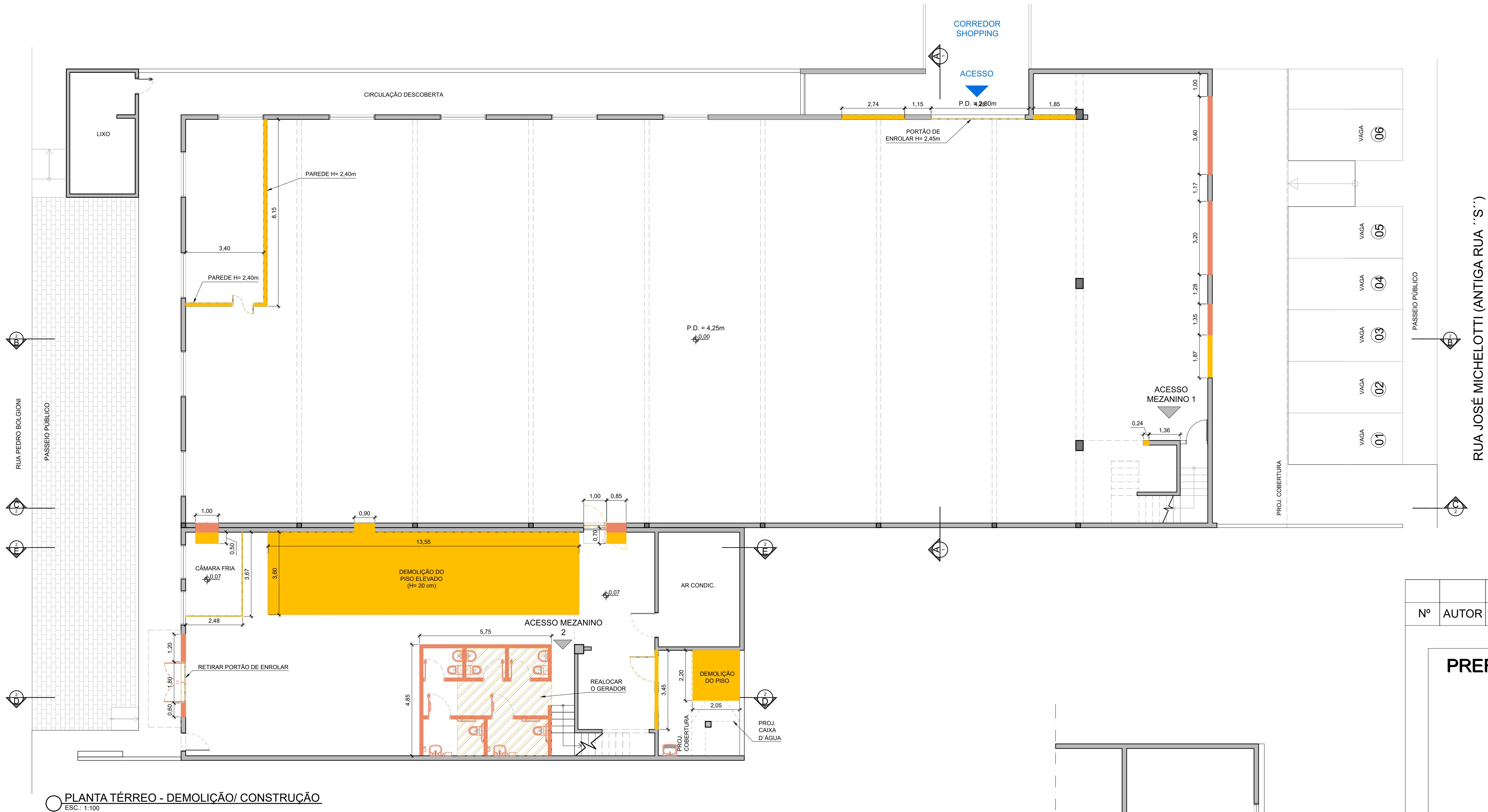
PLANTA TÉRREO - DEMOLIÇÃO/ CONSTRUÇÃO ESC.: 1:100